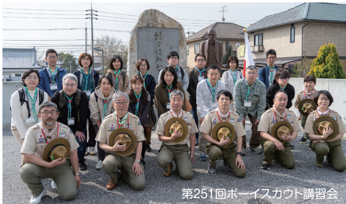
第251回ボーイスカウト講習会

ボーイスカウト岡山連盟には160名以上の指導者が登録されています。指導者はさまざまな職業をもった一般の成人の方方で、ボーイスカウト運動に共鳴し、ボランティアとして奉仕を続けています。振興財団は、より良い指導者の養成と継続にも積極的に支援を続けています。