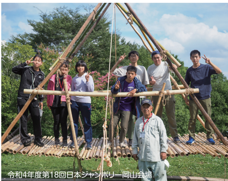
令和4年度第18回日本ジャンボリー岡山会場

一般財団法人岡山県ボーイスカウト振興財団は、岡山県内におけるボーイスカウト運動を助成・支援することを目的に昭和46年に結成されました。以来50年以上にわたって、地域のスカウト運動を支えてきました。