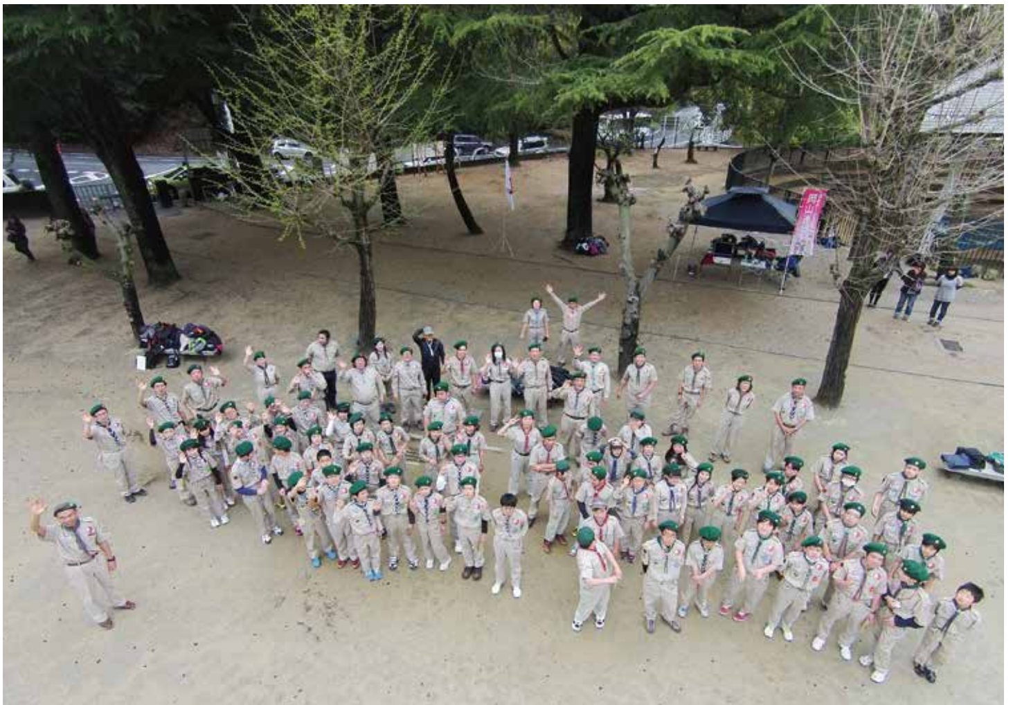
日本ボーイスカウト岡山連盟第1地区