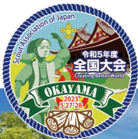
令和5年度全国大会 令和5年5月27-28日