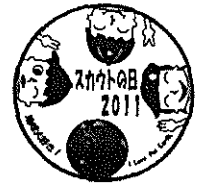
※昨年度のデザイン